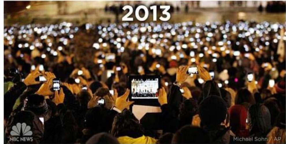
News Event: 2013