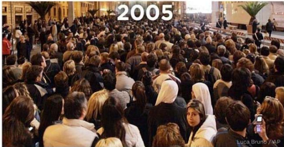
News Event: 2005